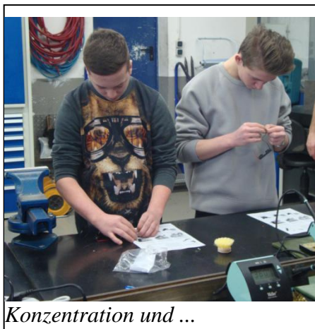
Konzentration und ...

Die restlichen Schüler wurden in der Lehrwerkstatt von Auszubildenden und deren Ausbildern