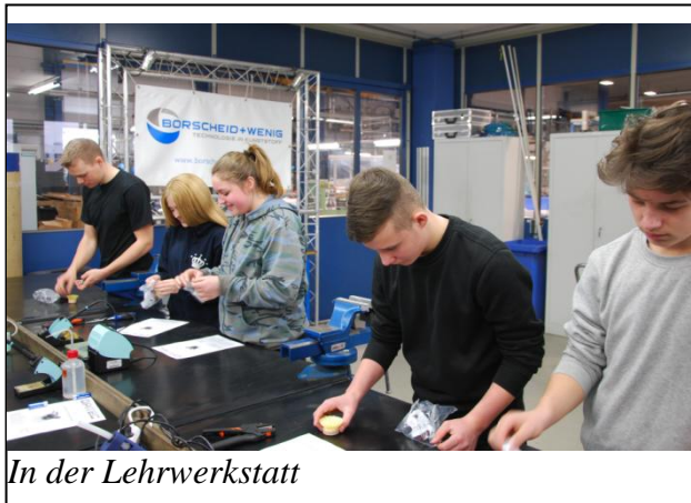
In der Lehrwerkstatt

Im Rahmen des von beiden Partnern der Schulpartnerschaft entwickelten Konzepts fanden die Erkundungen statt. Wichtig ist, dass die Schüler nicht nur reine Informationen über den Betrieb bekommen, sondern sich auch aktiv beteiligen können.