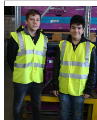
Sicherheit hat höchste Priorität

Vier Schüler bekamen eine Einweisung in eine Spritzgussmaschine und durften diese nach Anweisung bedienen und Kunststoffteile herstellen.